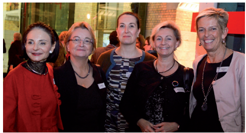
De gauche à droite :

EWoB souhaite également diffuser les meilleures pratiques de gouvernance, combinant des ambitions à la fois quantitatives (contribuer à augmenter le nombre de femmes dans les conseils) et qualitatives (proposer un vivier de compétences en ligne avec les évolutions