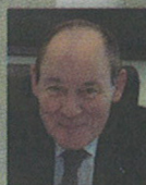
RENE RICOL COMMISSAIRE GENERAL A L'INVESTISSEMENT