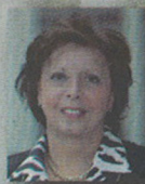
AGNES BRICARD PRESIDENTE DU CONSEIL SUPERIEUR DE L'ORDRE DES EXPERTS-COMPTABLES

Deux tables rondes en présence notamment de,